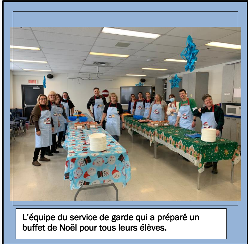
L'équipe du service de garde qui a préparé un buffet de Noël pour tous leurs élèves.