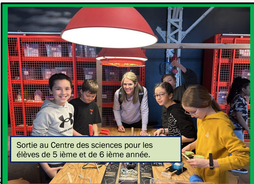
Sortie au Centre des sciences pour les élèves de 5 ème et de 6 ème année.