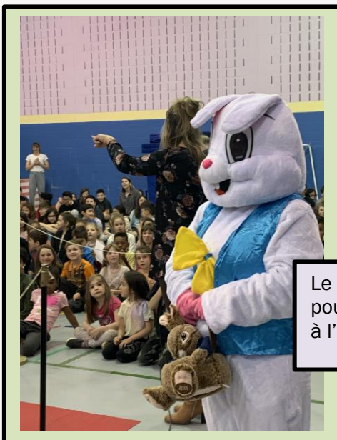
Le lapin de Pâques est venu remettre une poule en chocolat à chaque élève. Merci à l'OPP pour cette initiative!