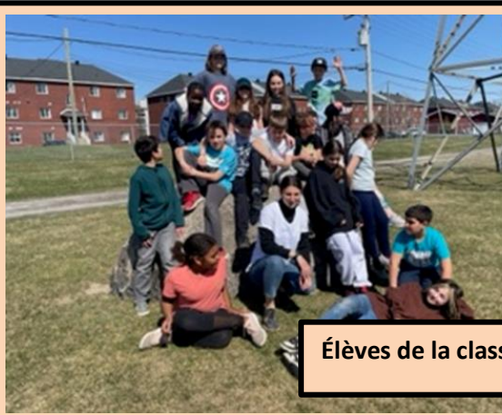
Élèves de la classe de Mme Fosse.

L'école sera quant à elle fermée le lundi 22 mai en raison du congé de la fête de la Reine.